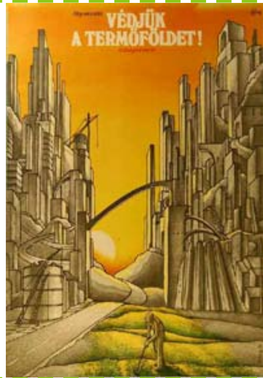
2 - Il n'est pas encore trop tard, défendons la terre arable! Nous en avons besoin! - Kakasy Eva - 1979

2 janvier 1950 : début du premier plan quinquennal de l'économie nationale. Son objectif principal est de moderniser le pays en donnant la priorité à l'industrialisation