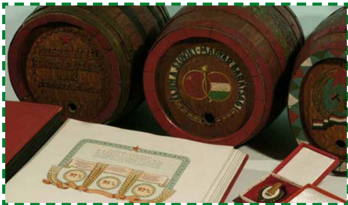
Trois tonneaux en bois célébrant le 60e anniversaire de Rákosi et l'amitié soviéto-hongroise