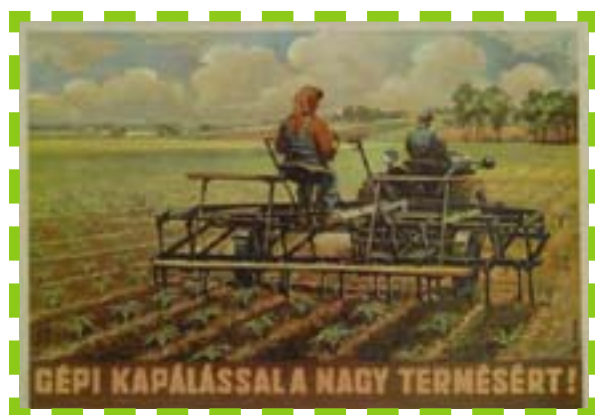
10 - Avec binage mécanisé pour la haute récolte - Pál György - vers 1950